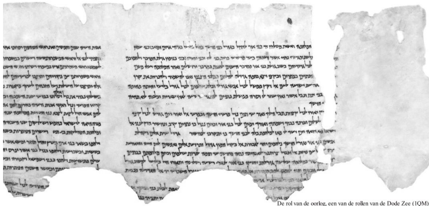
De rol van de oorlog, een van de rollen van de Dode Zee (1QM)

Maar vergeten we dat, dan dreigt te gebeuren wat we al zien in sommige Dode-Zeerollen. Zo is in de ‘boekrol van de oorlog’ ( what's in a name ) sprake van de ‘zonen van het licht’ en de ‘zonen van het donker’. De ‘zonen van het licht’ zijn ons-soort-mensen en de ‘zonen van het donker’ zijn uiteraard ander-soort-mensen. Dat zijn mensen die het licht niet hebben gezien – duistere mensen die bestreden moeten worden. Althans, dat is het patroon. En dat duikt telkens op in de geschiedenis.