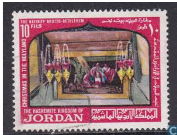
Een Kerstpostzegel uit Jordanië

De middagen die niet in de kerk worden gehouden zijn op de Rivierdijk 646.